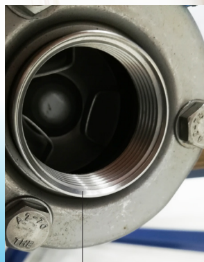
CLAPET DE RETENUE INOX