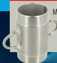
Mamelon de soutien