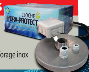
Cloche de forage inox