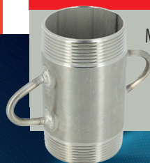
Mamelon de soutien